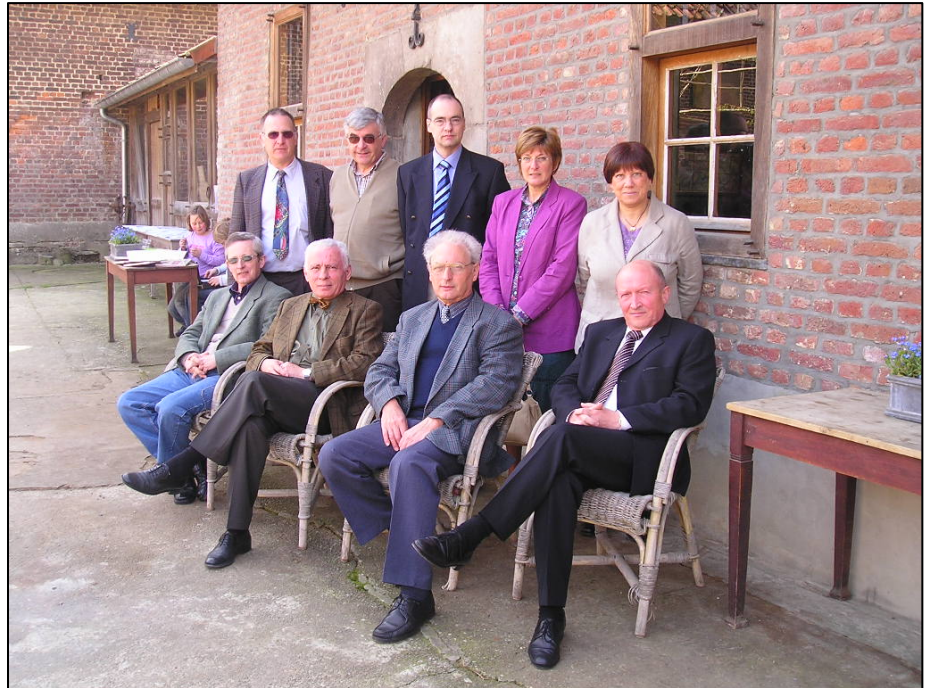
De aanwezige leden van Heemkunde Nieuwerkerken op de Erfgoeddag

→ Op zondag 30 april werd deze tentoonstelling ook bezocht door door de deelnemers aan de recreatieve fietshappening, georganiseerd door de Nationale Fietslus Vacantiegenoegens uit Herk-de-Stad en omgeving.